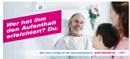
Sujets Spital Kampagne "Mein Herz schlägt für den Gesundheitsberuf"