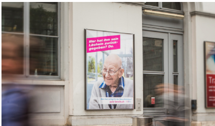
Plakat Bahnhof Stadelhofen

Auf die Gesundheitsberufe aufmerksam machen und das Image bei der Bevölkerung steigern